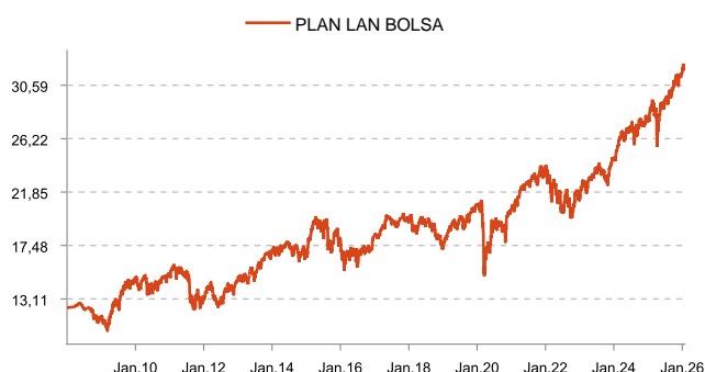
Errentagarritasuna PLAN LAN BOLSA