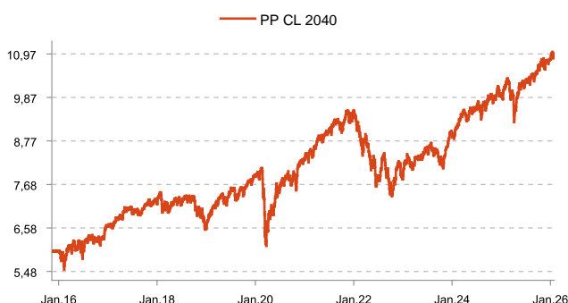
Errentagarritasuna PP CL 2040