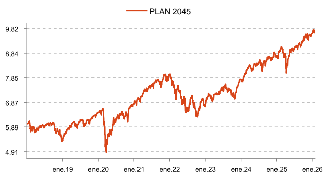
Rentabilidad PLAN 2045