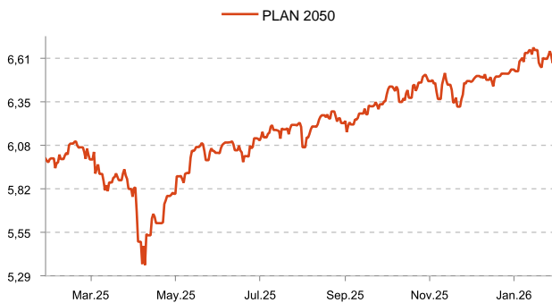
Errentagarritasuna PLAN 2050